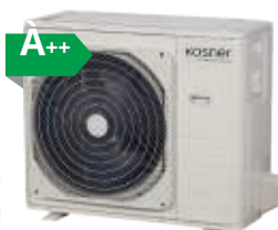
KSTi-30, 36, 42